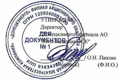
График временного отключения потребления с 01.06.2026 по 30.09.2026 гг. по "Донецкэнерго" филиалу АО "Юго-Западная ЭСК" на территории Донецкой Народной Республики